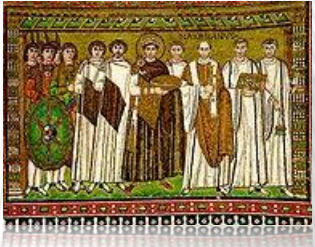
Το έργο του Ιουστινιανού και η Αγία Σοφία