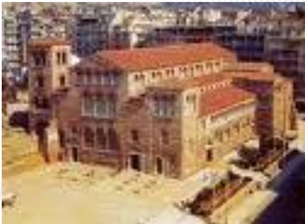
ΠΑΡΑΔΕΙΓΜΑ ΒΑΣΙΛΙΚΗΣ: ΝΑΟΣ ΑΓ. ΔΗΜΗΤΡΙΟΥ ΘΕΣΣΑΛΟΝΙΚΗΣ